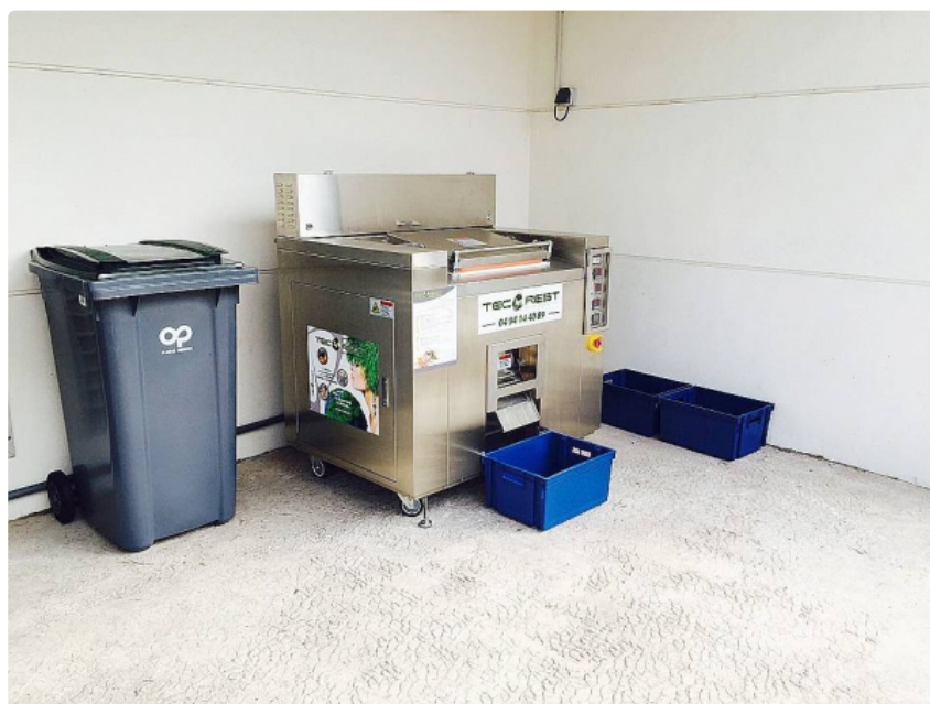
La machine qui "digère" les déchets alimentaires pour les transformer en compost. D.R. L'utilisation de l'article, la reproduction, la diffusion est interdite - LMRS - (c) Copyright Journal La Marseillaise

Écrit par Romain Alcaraz | lundi 28 mars 2016 08:29 | Imprimer