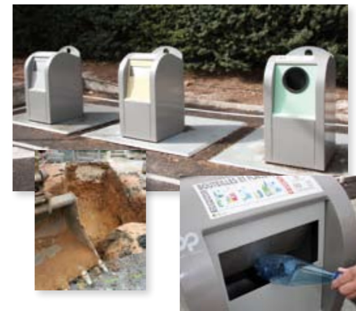
Dispositif colonnes enterrées La Valette du Var.

Pour permettre à un maximum d'habitants d'accéder au tri et à une gestion plus facile de l'ensemble de leurs déchets, tout en optimisant la collecte, le Sittomat a décidé d'investir dans des équipements de plus grand volume et de meilleure qualité, où chacun peut déposer à sa guise ses emballages ménagers recyclables après les avoir triés. La solution retenue est la mise en place de colonnes enterrées ou semi-enterrées pour le stockage des emballages ménagers recyclables.