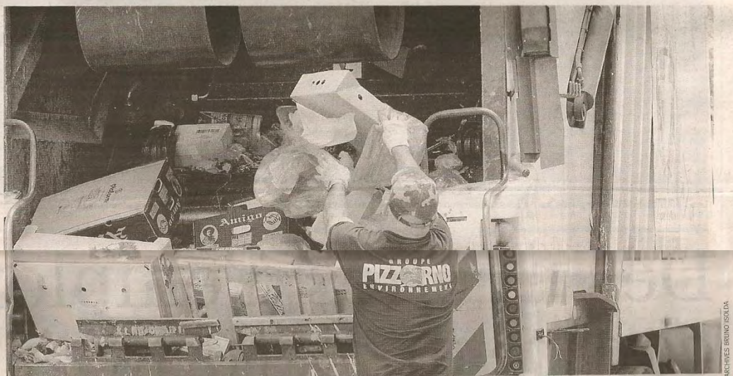
Les études de l'Ademe montrent que la quantité de déchets a doublé en 40 ans.

C'est précisément ce que se propose de faire le Sittomat sur l'agglomération toulonnaise tout au long de cette semaine. En postant ses Ambassadeurs du tri au plus près de l'acte d'achat, c'est-à-dire à l'entrée de 6 grandes surfaces de la zone d'influence. Une initiative labellisée par l'Ademe (Agence de l'environnement et de la maîtrise de l'énergie) qui fait partie des 2 000 opérations de terrain programmées un peu partout en Europe pour cette manifestation, destinées à tenter de réduire les quelque 2,7 milliards de tonnes de déchets municipaux générés chaque année par les 27 pays de l'UE. Une position stratégique (aux portes de la grande distribution) qui permet d'intervenir directement sur les consommateurs avant même que ces derniers remplissent leur caddie. Et leur faire éviter ainsi